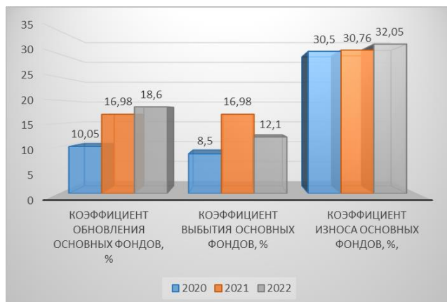
Рисунок 2 – Техническое состояние основных фондов ООО «Маныч-Агро»

Результаты анализа технического состояния основных фондов ООО «Маныч-Агро» представлены на рисунках 2 и 3.