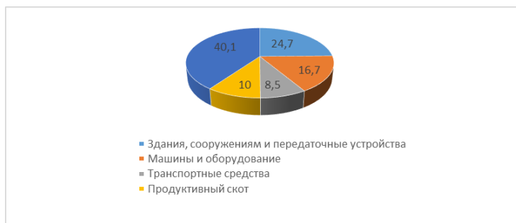
Рисунок 1 – Структура основных фондов ООО «Маныч-Агро» в 2022 году

В 2022 году на долю других видов основных фондов приходится наибольший удельный вес 40,1%. Их доля по сравнению с 2021 годом незначительно сократилась. Удельный вес зданий и сооружений составляет 24,7%, по сравнению с предыдущим годом увеличится на 3 пункта. Доля активной части основных фондов увеличилась на 7,9 пункта, что способствует увеличению фондоотдачи и увеличению объема производства.